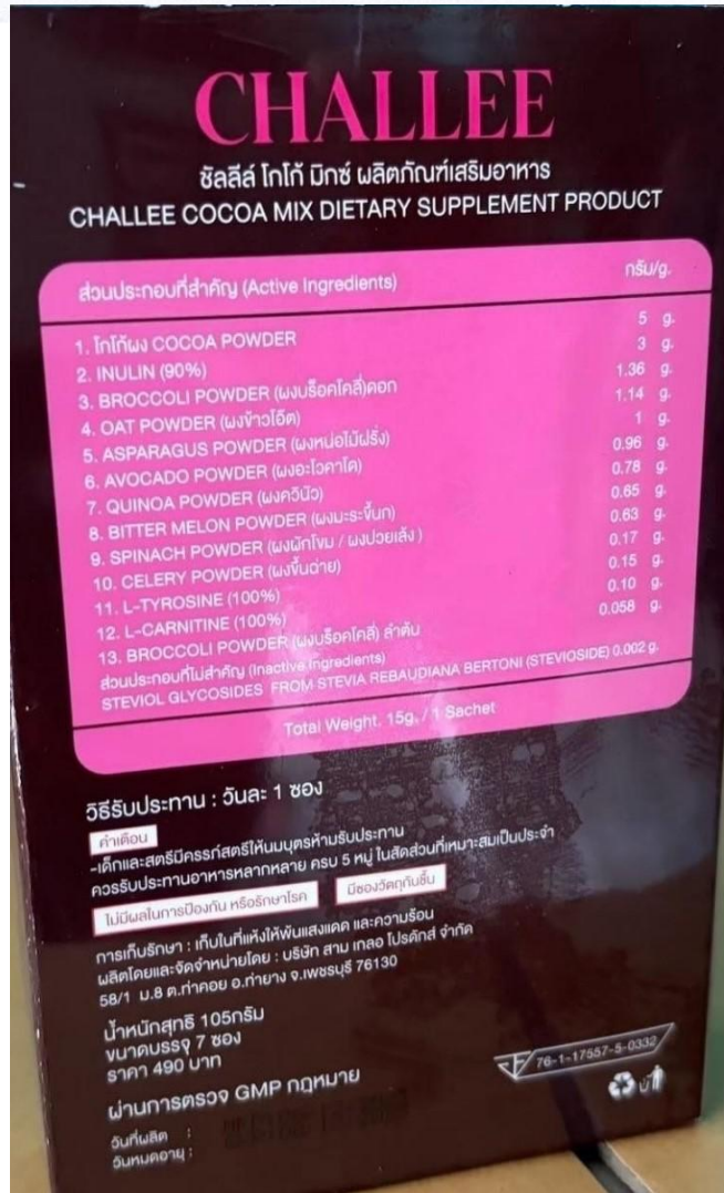
ภาพถ่ายผลิตภัณฑ์

ผลการตรวจพิสูจน์จากกรมวิทยาศาสตร์การแพทย์ผลิตภัณฑ์ดังกล่าว ตรวจพบ ซิบูทรามิน (Sibutramine) ซึ่งมีรายงานถึงผลกระทบต่อระบบหัวใจและหลอดเลือด ทำให้เกิดผลเสียร้ายแรงจนถึงแก่ชีวิต จัดเป็นวัตถุที่ออกฤทธิ์ต่อจิตและประสาทในประเภท ๑ ตามประกาศกระทรวงสาธารณสุข เรื่อง ระบุชื่อวัตถุออกฤทธิ์ในประเภท ๑ พ.ศ. ๒๕๖๕